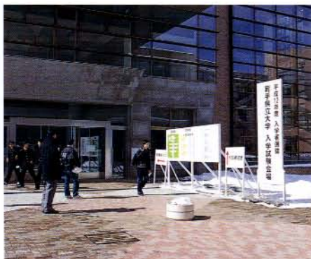
2月25日の前期日程試験には、雪の中、昨年に倍する(総合政策学部)受験生が続んだ

ている問題意識の豊かさ、分析力の深さといったものが表現されていなくても多かった。総合政策学部の授業では、現代社会が抱えるあらゆる問題が